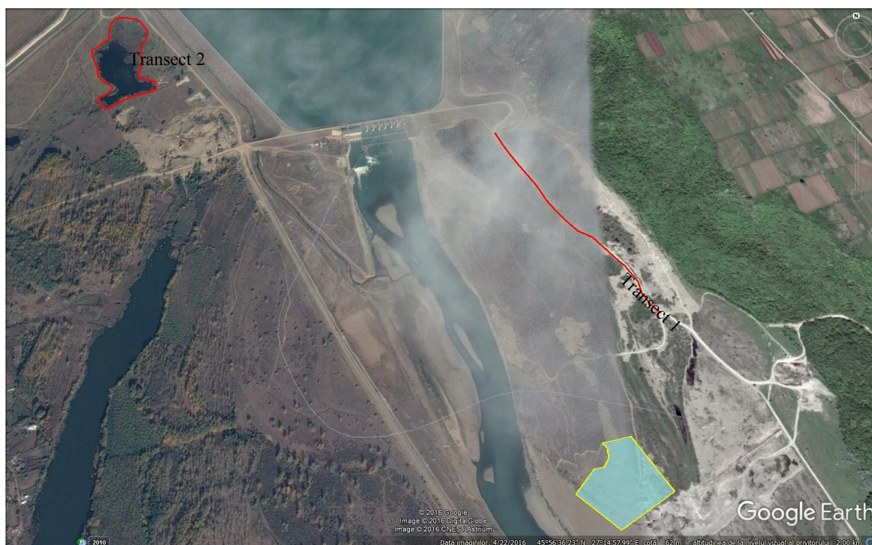
Figura nr. 6. Transectele stabilite pentru monitorizare

În cazul de față, au fost realizate două transecte, cu o lungime de aproximativ 1 km, fiecare.