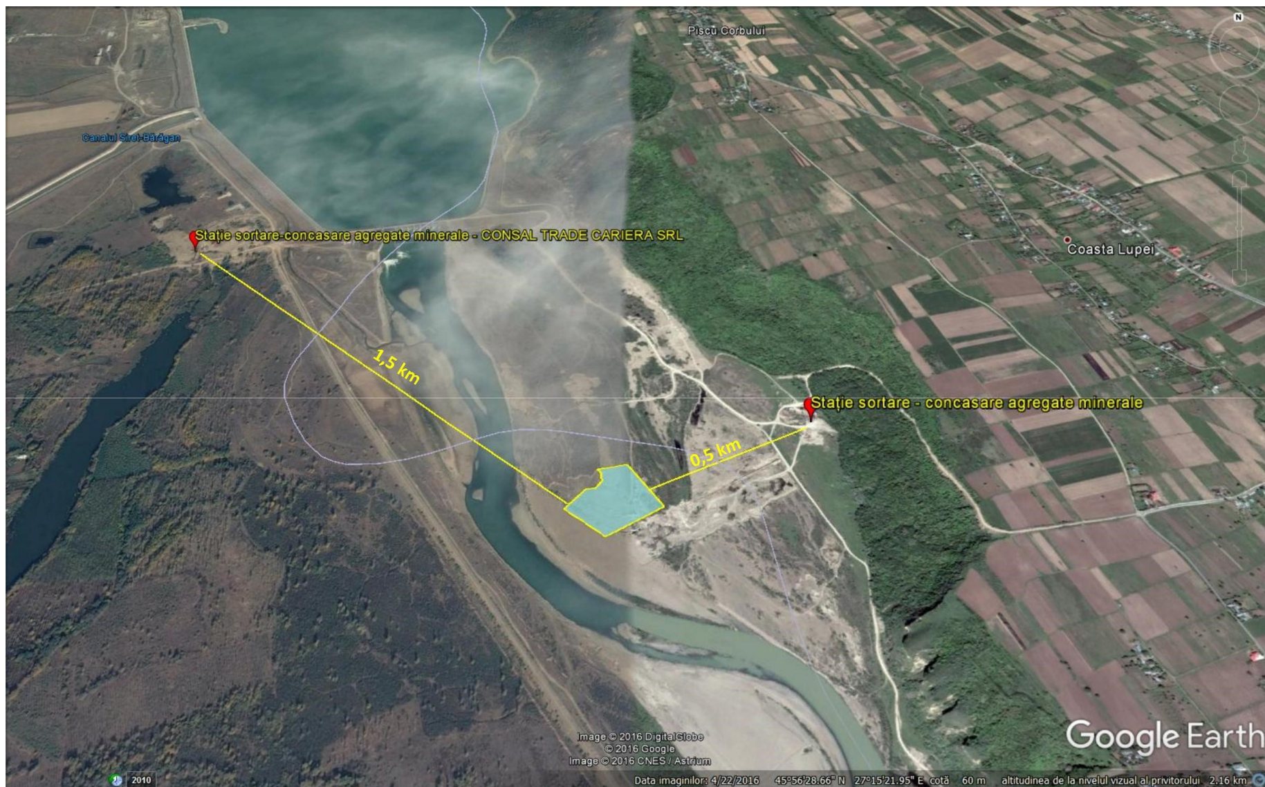
Figura nr. 3. Localizarea perimetrului de exploatare în raport cu stațiile de sortare-concasare agregate minerale din zonă