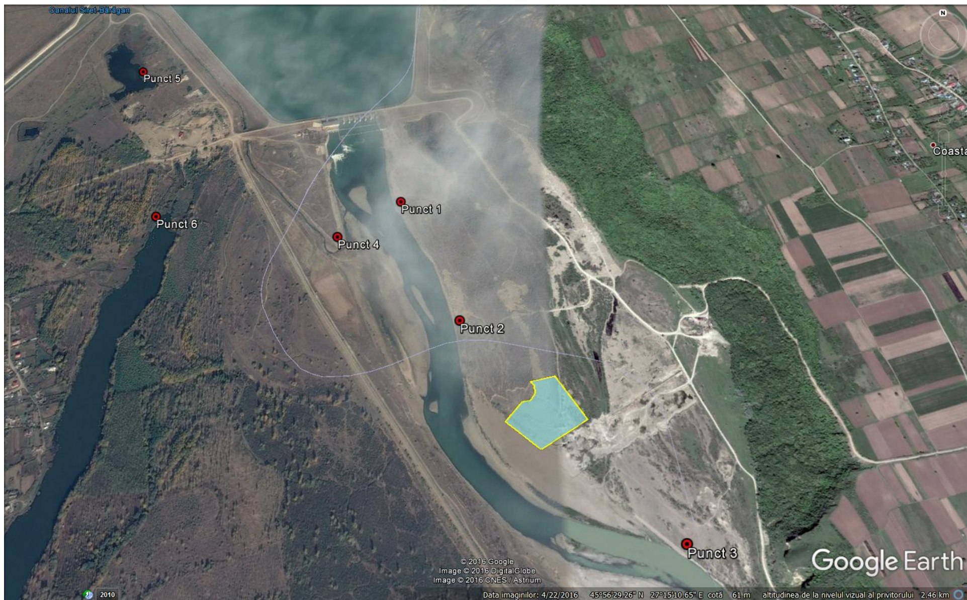
Figura nr. 5. Localizarea punctelor de observație