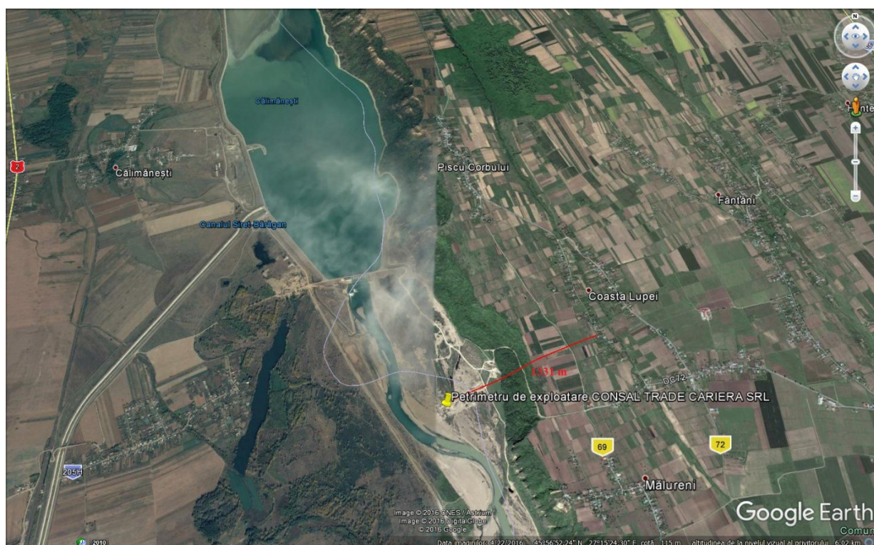
Figura nr. 2. Localizarea obiectivului studiat față de zona locuită

Perimetrul de exploatare, aparținând CONSAL TRADE CARIERA SRL, se află la distanțe relativ mari față de zonele rezidențiale, cea mai apropiată locuință fiind la aproximativ 1300 m.