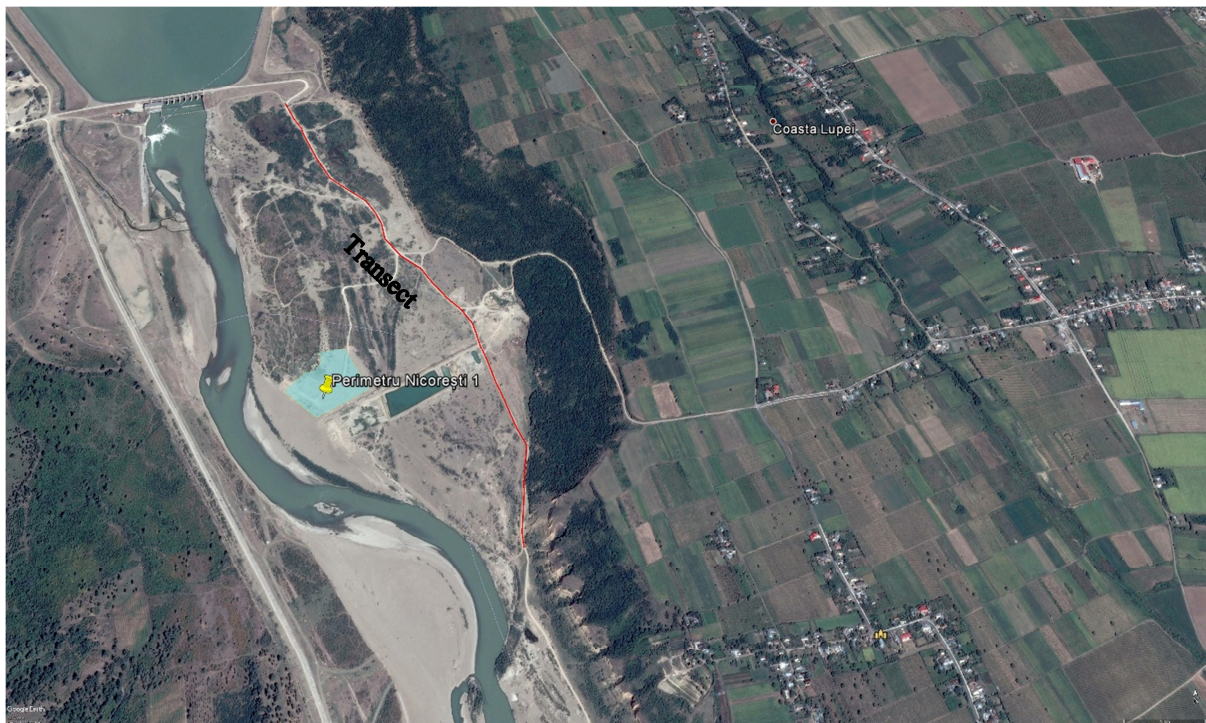
Figura nr. 6. Transect stabilit pentru monitorizare

În cazul de față, au fost realizate un transect, cu o lungime de aproximativ 2 km.