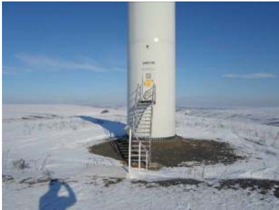
Ex: Vizibilitate ridicata (luna ianuarie)