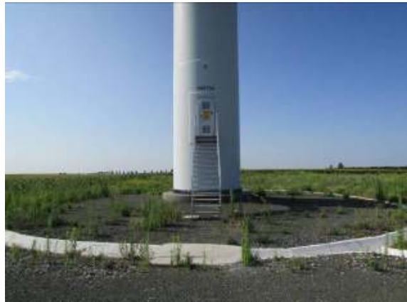
Ex: Vizibilitate redusa cu exceptia platformei si a fundatiei (luna iulie) (se impune aplicarea protocolul de lucru)

In vederea identificarii carcaselor de pasari si lilieci, s-au efectuat 2 deplasari/luna, tinandu-se cont si de efectuarea vizitei in teren ulterior unor fenomene meteo extreme.