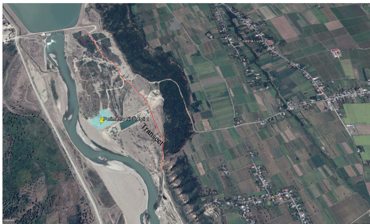
Figura nr. 6. Transect stabilit pentru monitorizare

În cazul de față, au fost realizate un transect, cu o lungime de aproximativ 2 km.