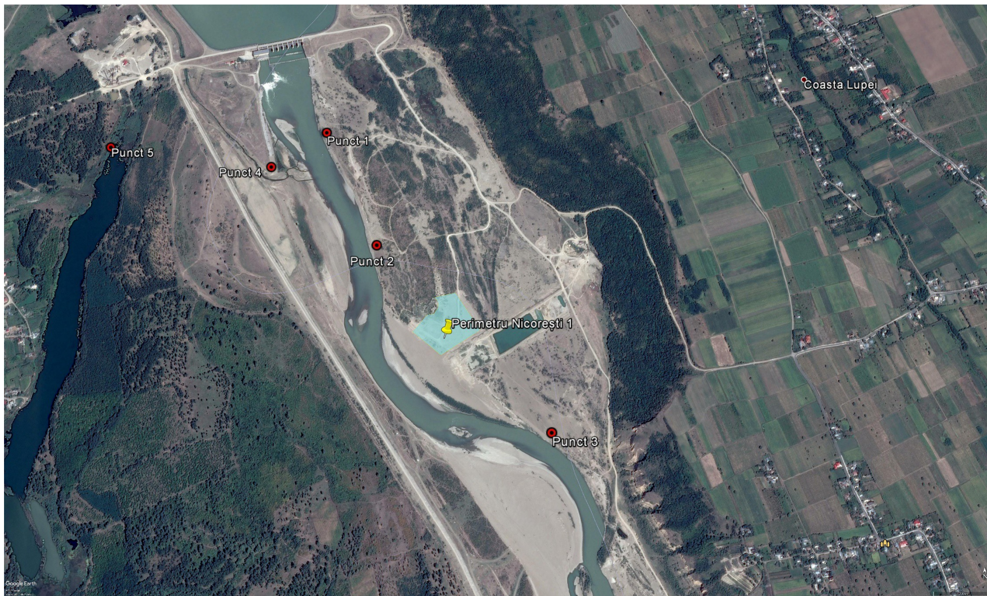
Figura nr. 5. Localizarea punctelor de observație