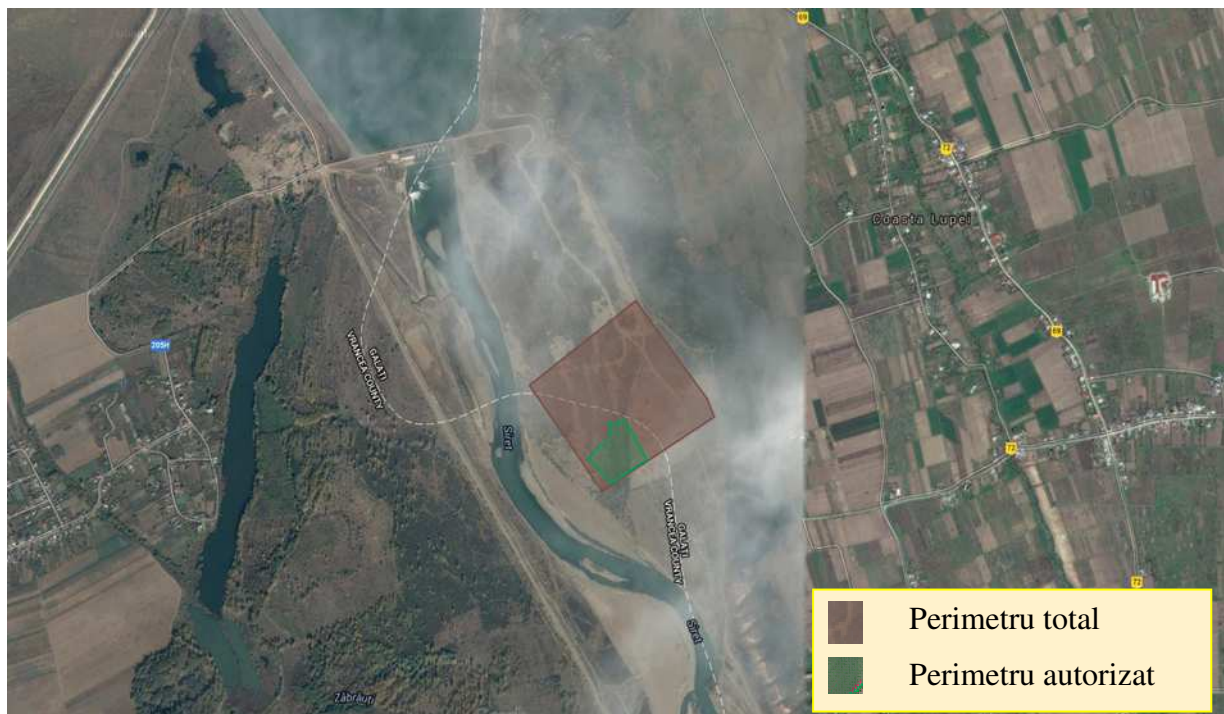
Figura nr. 1. Localizarea perimetrului de exploatare

Accesul rutier la balastiera se face din E 85 București-Suceava, din localitatea Hăret, pe un drum neasfaltat (DC ce duce în localitatea Padureni) în lungime de 4 km, apoi pe drumul de exploatare cu o lungime de 1,5 km, până la perimetru, trecerea de pe malul drept al râului Siret pe malul stâng făcându-se peste coronamentul barajului de la Calimănești.