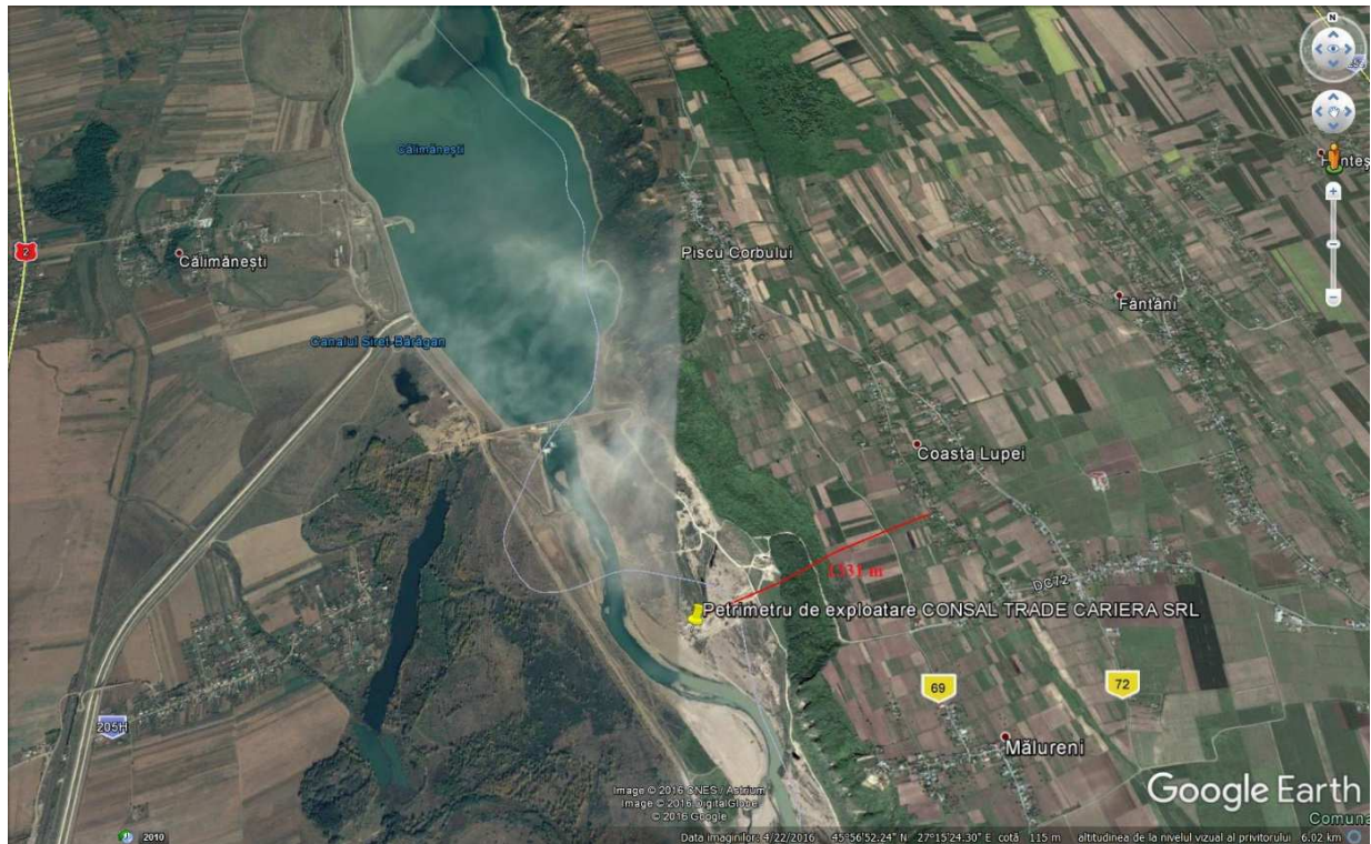
Figura nr. 2. Localizarea obiectivului studiat față de zona locuită

În vecinătatea amplasamentului studiat se află două stații de sortare-concasare agregate minerale, una dintre acestea, aparținând CONSAL TRADE CARIERA SRL. Activitatea desfășurată este reglementată prin autorizația de mediu nr. 07 din 26.01.2016, valabilă până la data de 26.01.2021, eliberată de Agenția pentru Protecția Mediului Vrancea.