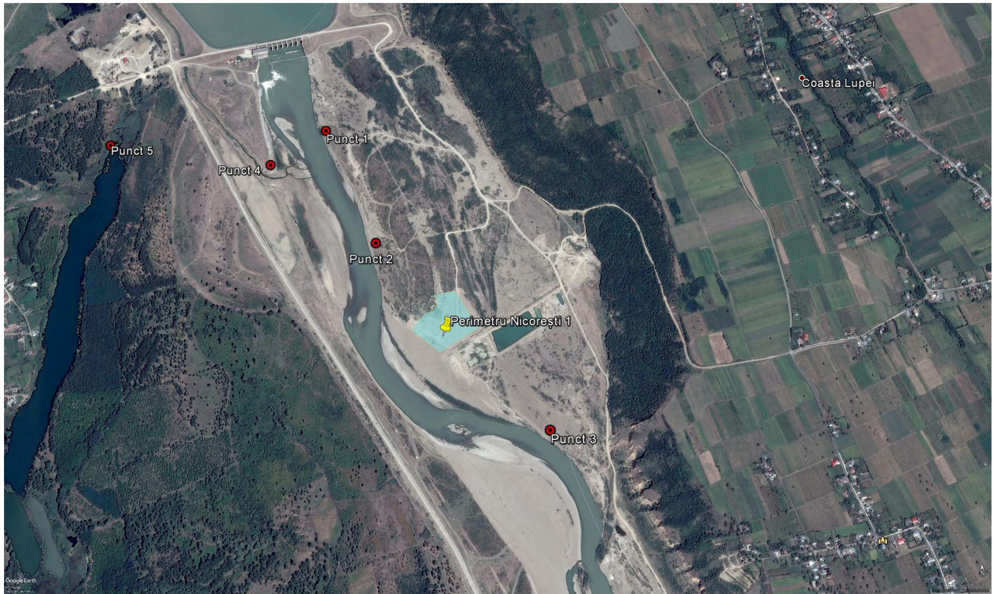
Figura nr. 5. Localizarea punctelor de observație