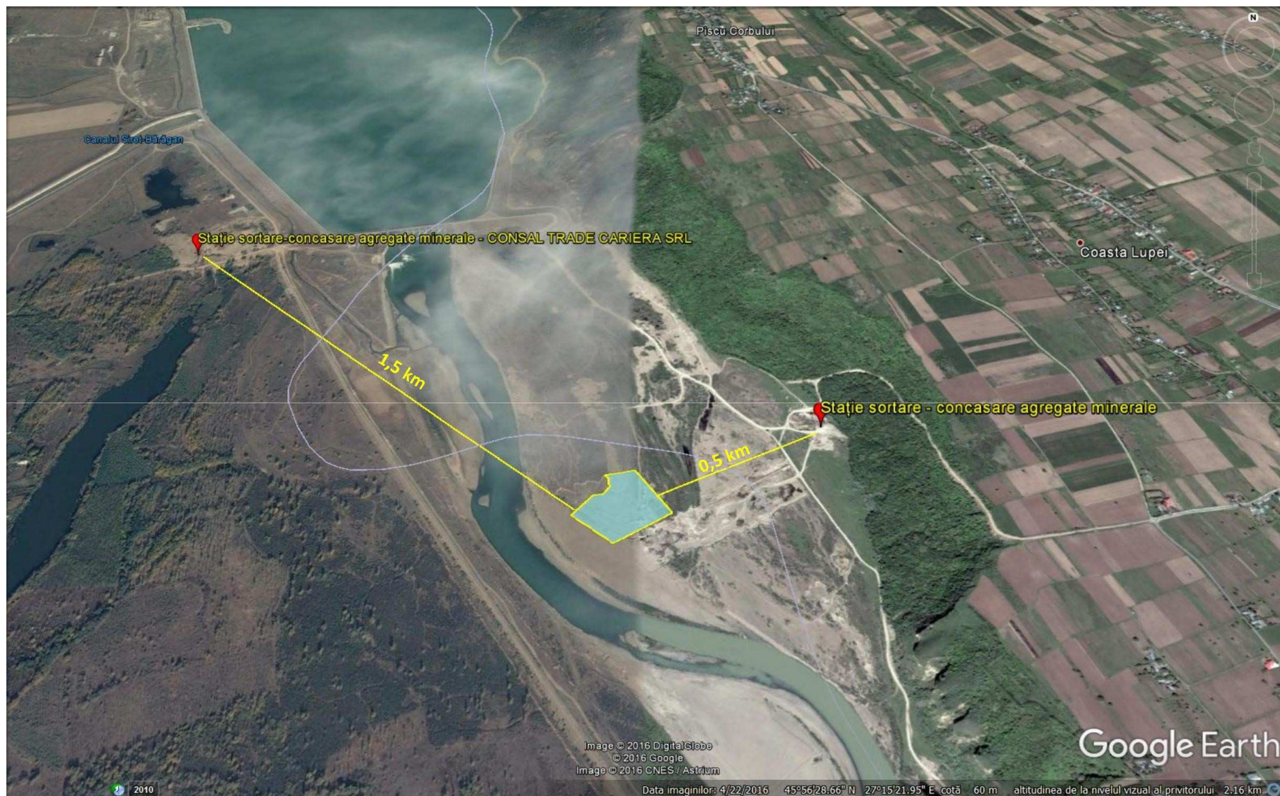
Figura nr. 3. Localizarea perimetrului de exploatare în raport cu stațiile de sortare-concasare agregate minerale din zonă