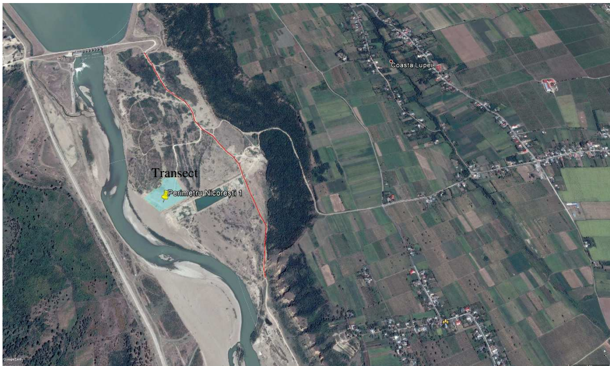
Figura nr. 6. Transect stabilit pentru monitorizare

În cazul de față, au fost realizate un transect, cu o lungime de aproximativ 2 km.