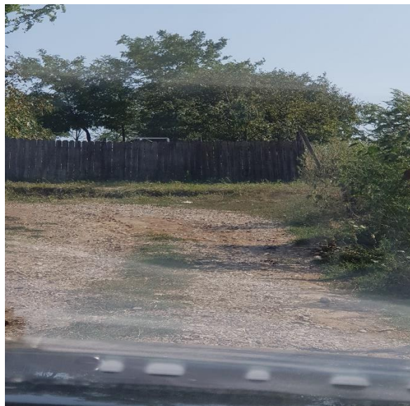
Foto 02. Situatia existenta a strazilor