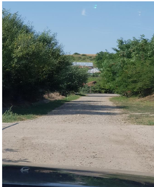
Foto 04. Situatia existenta a strazilor