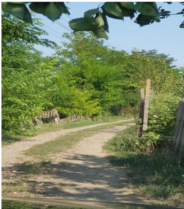
Foto 03. Situatia existenta a strazilor