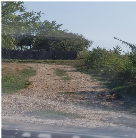
Foto 01. Situatia existenta a strazilor