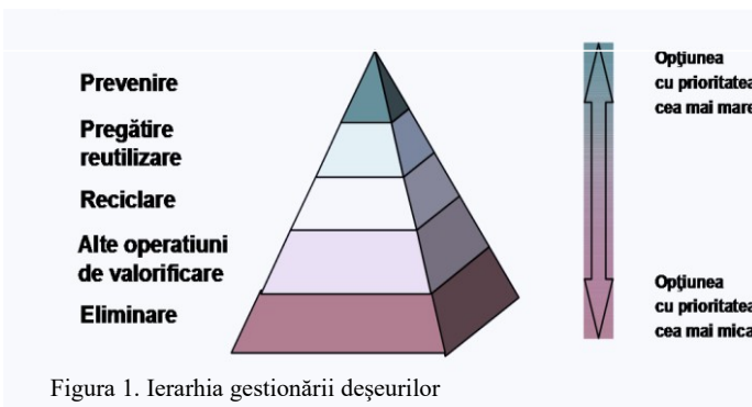
Figura 1. Ierarhia gestionării deșeurilor

Valorificare - orice operațiune care are drept rezultat principal faptul că deșeurile servesc unui scop util prin înlocuirea altor materiale care ar fi fost utilizate într-un anumit scop, sau faptul că deșeurile sunt pregătite pentru a putea servi scopului respectiv, în întreprinderi sau în economie în general.